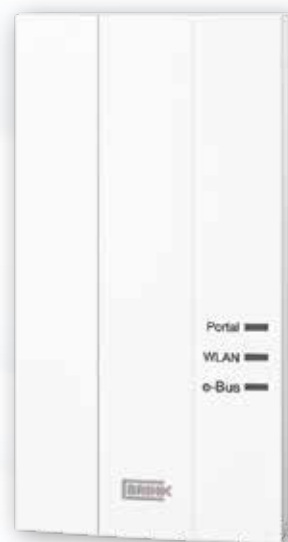
Brink Home Module

Brink Home est commercialisé depuis fin 2015. Le système de ventilation complet est alors réglable par un seul système intelligent.